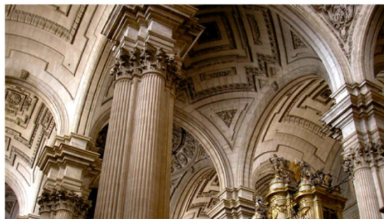
Celebración del "V Taller Internacional de Paisaje" en el marco excepcional de la Catedral de Jaén.